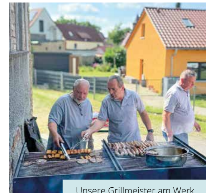
Unsere Grillmeister am Werk

Neben der Abarbeitung der wichtigen Formalien soll eine Mitgliederversammlung auch den Zusammenhalt in der Genossenschaft fördern. Dabei kam der strahlende Sonnenschein an diesem Tag wie gerufen. Denn anschließend wurde gegrillt. Neben Klassikern wie Würstchen und leckeren Steaks erfreuten auch vegetarische Alternativen die Gaumen unserer Mitglieder.