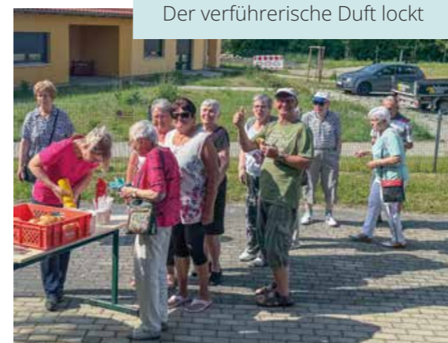
Der verführerische Duft lockt

Gemeinsam mit der Mieterschaft wurden wichtige Themen und Anliegen besprochen. Wie immer werden die Anregungen und Wünsche aufgenommen.