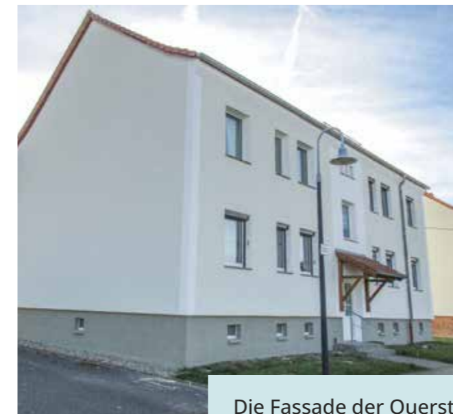
Die Fassade der Querstraße 7 nach der Sanierung im fertigen Zustand

Rissbildung in der Fassade des Hauses machte den lokalen Rückbau der Fassadendämmung notwendig. Zur Stabilisierung des Hauses und zum Vorbeugen vor weiteren Rissbildungen wurden vier Zuganker angebracht. Nach dem Verputzen der Fehlstellen und der malermäßigen Instandsetzung erfolgt die Aufarbeitung des Sockels und der Eingangsüberdachung.