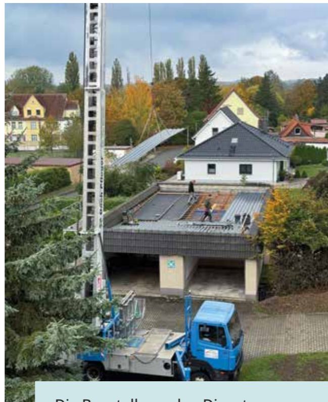
Die Baustelle an den Dienstgaragen

Mit der PV-Anlage und der sukzessiven Umstellung des Fuhrparks auf rein elektrische Fahrzeuge oder E-Hybrids will die Wohnbau langfristig Kosten- und Emissionseinsparungen erreichen.